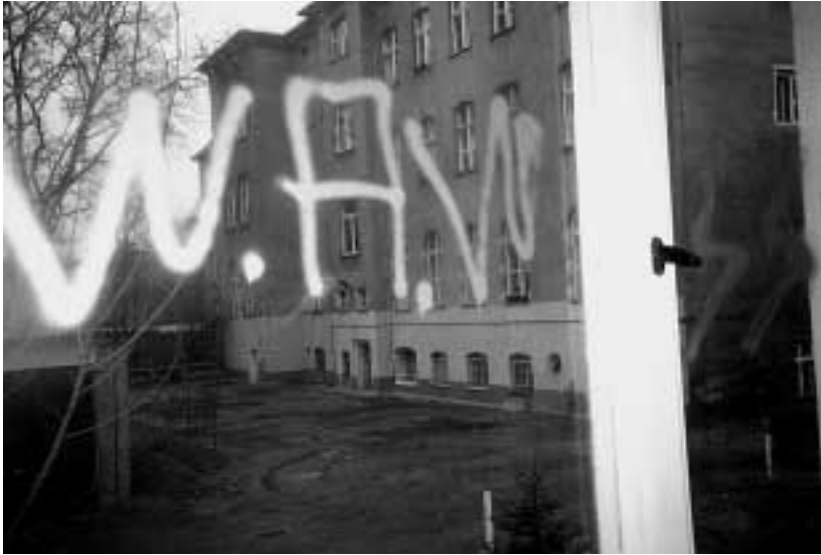
1994 wurde die Geschäftsstelle der PDS-Weißensee durch eine Gruppe „Weißenseer Arischer Widerstand bedroht.

sprach Diesner in frühen Vernehmungen auch von „Kameraden“, mit denen er sich zwischen dem 15. und 19. Februar getroffen habe. An anderer Stelle weigert er sich, Angaben zu machen, weil er sonst „Zellenstrukturen“ preisgeben würde.